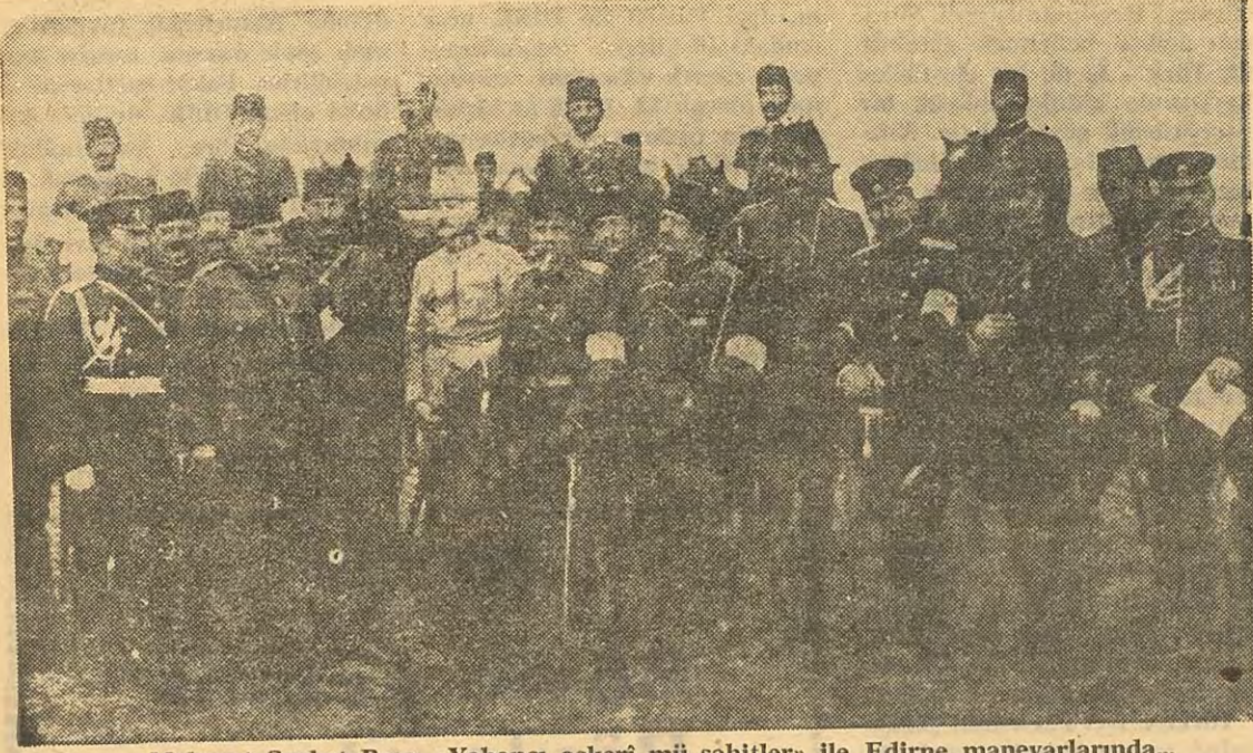
Mahmut Şevket Paşa, «Yabancı askerî mü şahitler» ile Edirne manevralarında...