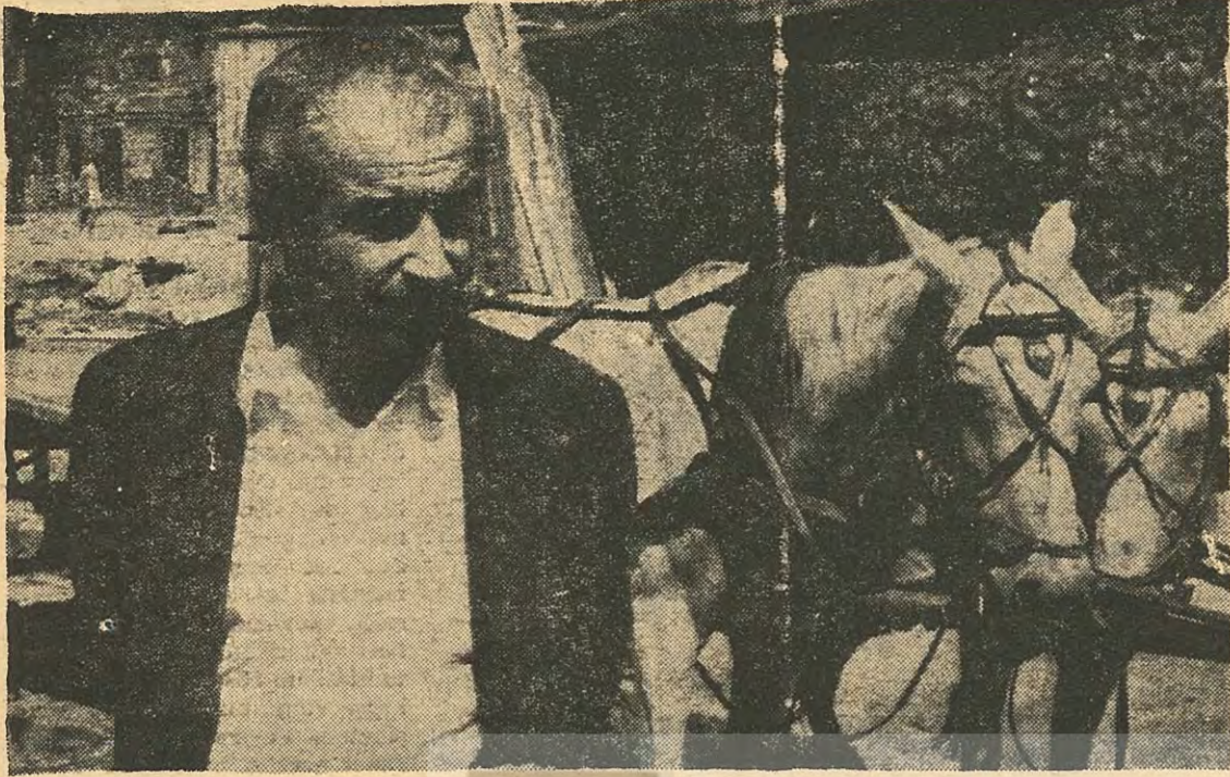
«72 nci Koğuş» un yazarı Orhan Kemal