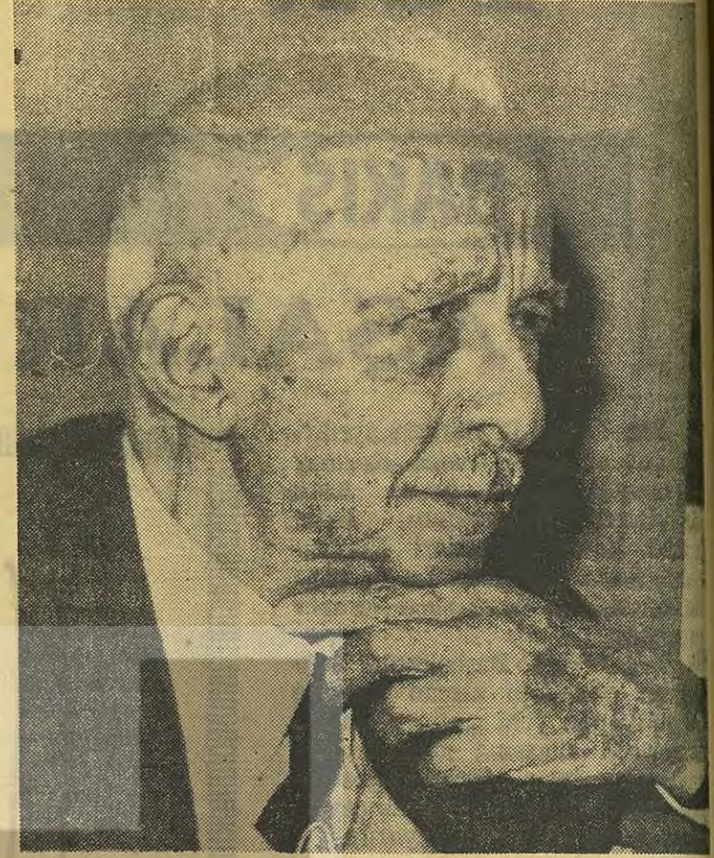
CHP Genel Başkanı İSMET İNÖNÜ Nasihat ediyor..

Fazıl Hüsnü Dağlarca'nın geçen sayımızda yayınlanan «Davul II» adlı şiirinin dördüncü kıtasının son mısraındaki «ulusun» kelimesi, yanlış olarak «ulunun» olarak çıkmıştır. Bu duruma göre, bahis konusu mısra «Şu ulusun işine bak» olacaktır. Okuyucularımızdan ve değerli şairden özür dileriz.